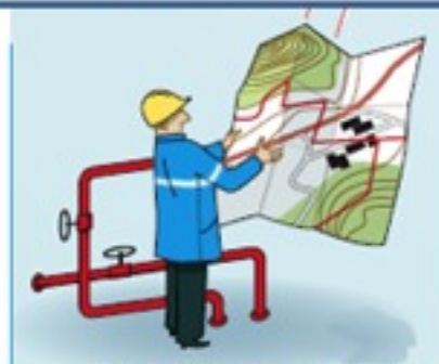
Exploitants de réseaux