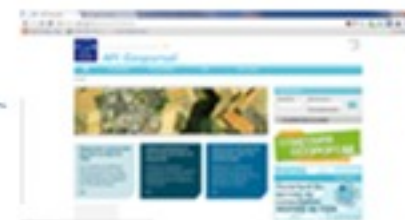
GéoPortail / RGE