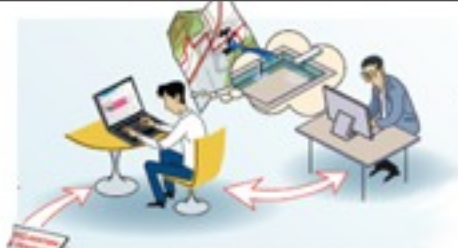
Responsables de projet Exécutants de travaux