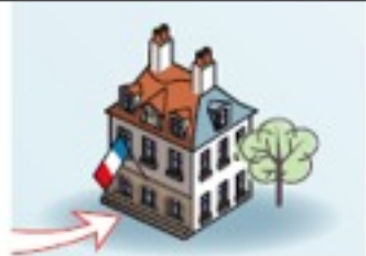
Collectivités territoriales Services de l'état