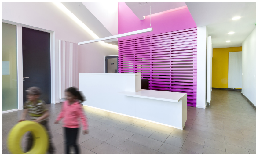
Maison de santé pluridisciplinaire - Ancerville (55) Ambert-Biganzoli, architectes

Le montant de la prime est fixé à minima à 80 % du prix estimé des études demandées aux candidats (généralement du niveau de l'esquisse ou de l'avant-projet sommaire).