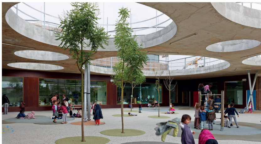
Gruppe scolaire Lucie Aubrac, Toulouse, 2012, Laurens & Loustau arch.

L'appel d'offres, qui est la procédure traditionnelle d'achat des fournitures, n'est donc pas approprié aux marchés de prestations intellectuelles. C'est d'ailleurs pour cette raison qu'il est proscrit en procédure formalisée dès qu'il y a conception architecturale.