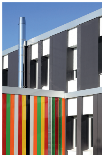
Le Compas dans l'œil, Anne Montrieul, Vincent Brugierolles architectes, rénovation du collège Baudelaire à Clermont-Ferrand (63)

Alors que le rôle de la maîtrise d'œuvre est de défendre les intérêts du maître d'ouvrage pendant toute la durée de l'opération, les équipes sont trop souvent sélectionnées sur le montant des honoraires ou la brièveté des délais qu'ils vont consacrer à la réalisation de leur mission. Cela constitue l'inverse d'une démarche qualité et va se révéler au final très dommageable pour la collectivité, la bonne gestion des deniers publics et la réussite de l'opération.