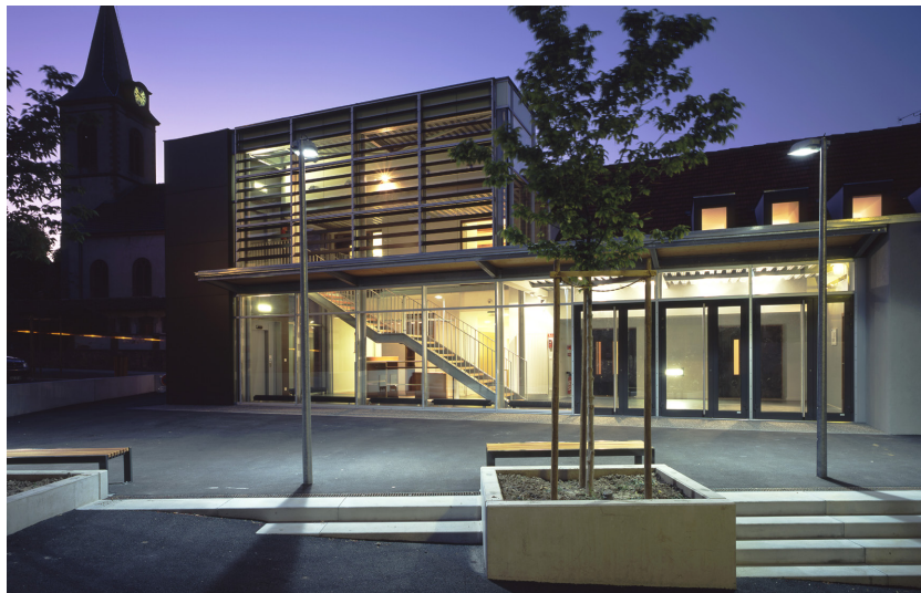
Extension et restructuration de la salle des fêtes, Beblenheim, Auger-Rambeaud architectes, 2006

Ce guide dispose désormais d'une version numérisée, dénommée « Simulateur d'honoraires », accessible sur le site de la MIQCP ( www.miqcp.gouv.fr ). Il s'agit d'un outil d'évaluation prévisionnelle des honoraires pour des opérations de construction neuve de bâtiments.