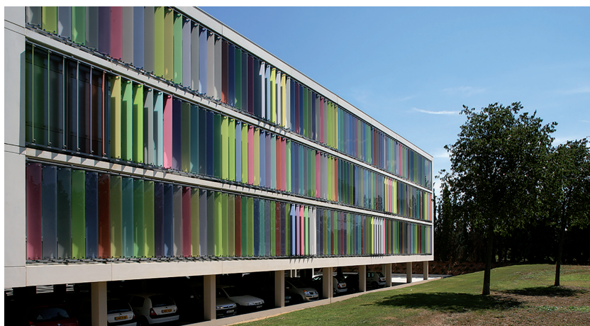
Hôtel communautaire du Grand Avignon (84), 2007, Jacques Fradin & Jean-Michel Weck arch. associés

N.B. : Aucune disposition du code des marchés publics ne prévoit ni la pondération, ni la hiérarchisation des critères de sélection des candidatures.