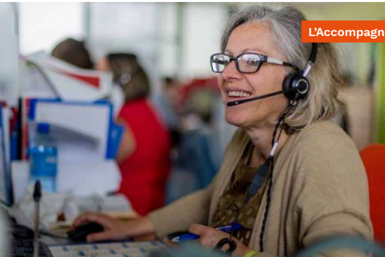
L'Accompagnement Énergie : au service de tous les clients en difficulté

Des solutions sur mesure pour lutter contre la précarité énergétique